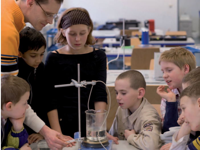
Ein Forscherteam experimentiert mit Formgedächtnismaterialien.

Der Besuch der Schülerlabore ist kostenfrei.